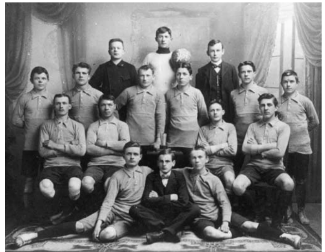
Mannschaftsfoto aus einer längst vergangenen Zeit

Von Biberist aus wurde ab 1948 die Sektion der SFAV-Veteranen organisiert. Die Sektion zählt heute über 330 Mitglieder, wovon 33 aus den Reihen des FC Biberist.